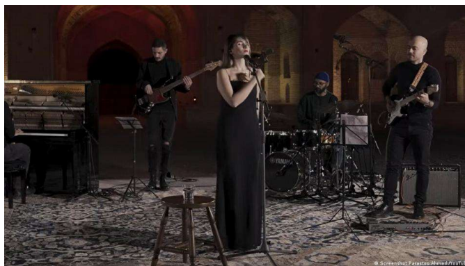
حسین عزیززاده دست‌اندرکاران کنسرت کاروانسرا را «هنرمندانی با استعداد» خوانده و شجاعت‌شان را تحسین کرد.