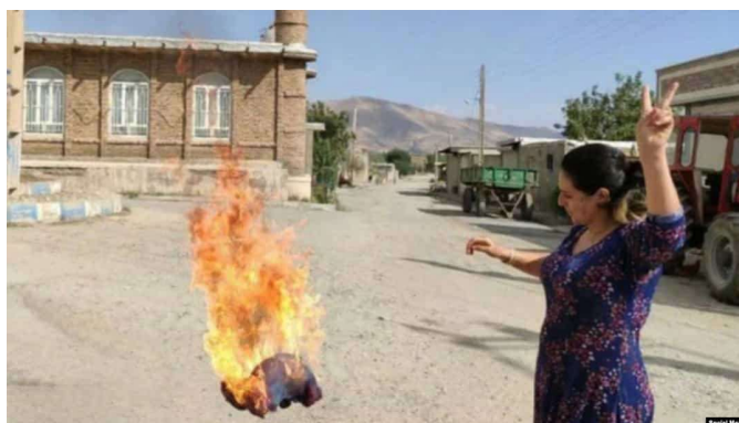
زنی در کردستان در حمایت از قیام ژینا روسری اش را آتش می‌زند

در ادامه تمام این مباحث و تعاریف، آن چه که این جنبش را تا این حد متمایز و یگانه می‌کند جسارت انقلابی زنان است. اتفاقی که در روز خاکسپاری ژینا در گورستان شهر سقز رخ داد؛ زانی که به واسطه آن رخداد به فاصله کوتاهی تبدیل به هنرمند و فعال مدنی شدند. آن‌ها خالصانه و خلاقانه اثر هنری ماندگاری آفریدند که به گویاترین و گیراترین حرکت اعتراضی بدل شد.