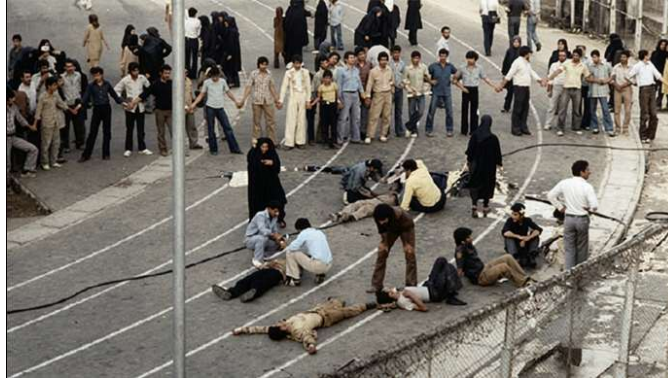
تصویری از: تظاهرات ۳۰ خرداد ۱۳۶۰

این نخستین بار نیست که مقام‌های فرانسوی برای محدود کردن گردهمایی‌های مجاهدین خلق به دلایل امنیتی اقدام می‌کنند. در سال ۲۰۲۳ نیز پلیس پاریس یک تجمع این گروه را ممنوع کرده بود، اما دادگاه اداری بعداً آن تصمیم را لغو کرد. لغو گردهمایی امسال سازمان مجاهدین خلق و شورای مقاومت ملی ایران، در شرایطی رخ می‌دهد که توافق تازه تهران و واشنگتن، جنگ منطقه‌ای را موقتاً متوقف کرده، اما بحث آزادی بیان، حقوق بشر، اعدام‌ها و سرکوب داخلی در ایران، همچنان یکی از محورهای اصلی اعتراض ایرانیان مترقی و آزادی‌خواه و سرنگونی‌طلب خارج از کشور است.