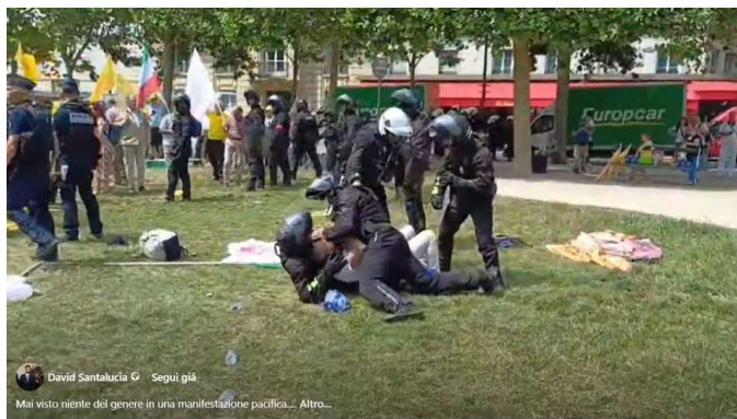
حمله پلیس فرانسه به تظاهرات اعتراضی سازمان مجاهدین خلق علیه اعدام‌های جمهوری اسلامی در ایران

«تظاهرکنندگان در حمایت از اپوزیسیون ایران در پاریس، در میدان ووبان و در نزدیکی انولید تجمع کردند. آنها ممنوعیت تظاهرات صادر شده از سوی دادگاه اداری پاریس را که در واقع تاییدی بر تصمیم فرمانداری پلیس بود، به چالش کشیدند. ۲۰ نفر توسط نیروهای انتظامی بازداشت شده‌اند که از گاز فلفل نیز استفاده کردند. چندین زخمی در میان تظاهرکنندگان گزارش شده است.»