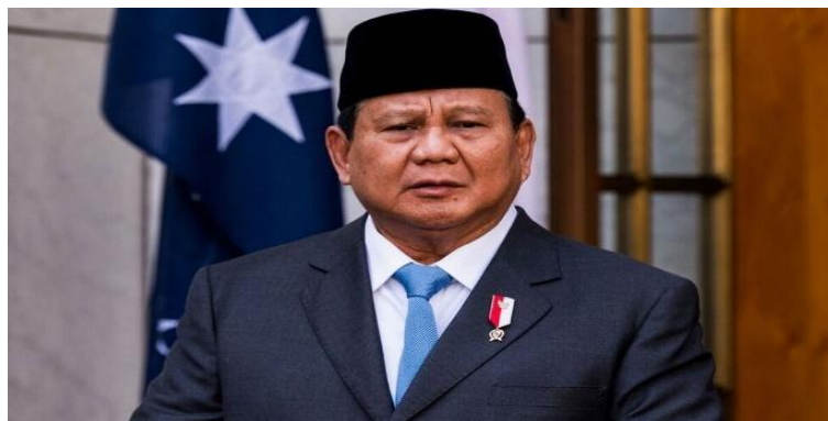
پرابوو سوبیان‌تو رئیس‌جمهور اندونزی

انتشار ویدئوهایی از سبک زندگی مجلل برخی سیاست‌مداران در شبکه‌های اجتماعی، هم‌زمان با افزایش هزینه‌های زندگی و موج اخراج‌ها، شکاف میان حاکمیت و جامعه را پررنگ‌تر کرده و دامنه اعتراض‌ها را گسترش داده است.