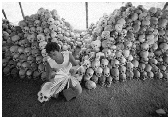
مارگارت اسکات پژوهش‌گر و کارشناس مسائل خاور دور - مستندی در مورد چگونگی کشتار کمونیست‌ها در اندونزی

از سال ۲۰۰۶، هر پنج‌شنبه گروهی آرام در مقابل کاخ ریاست جمهوری در جاکارتا گرد می‌آیند. با لباس‌های سفید و سیاه و تکان دادن چترهای سیاه. ۶۰ نفری از همه نسل‌ها. همه قربانیان جنایاتی هستند که هرگز به آن‌ها رسیدگی نشده. (فیلیپ پتود سلییه را بخوانید «اقلیت‌های پاپوس در پاپوآسی» لوموند دیپلوماتیک فوریه ۲۰۱۵) خانواده دانشجویان به قتل رسیده، فعالان ناپدید شده طی سرکوب سال ۱۹۹۸ و چهره‌های تکیده باز ماندگان سال ۱۹۶۵. با عکس‌های ناپدید شدگان و دست‌نوشته‌ها روی زمین، پیر مردی با چندین جمجمه مصنوعی و پلاک ۱۹۶۵. و چنین شعار می‌دهند: رییس جمهور اقدام کنید، زود، زیرا زمان می‌گذرد و اثرات جنایات محو می‌شود.