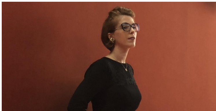
کارگردان فرانسوی ایوا هوسون

فیلم دختران آفتاب از جمله در ۲۴مین جشنواره بین‌المللی فیلم ژنو به نمایش درآمد. این فیلم به مقاومت زنان کرد در سنگال و روزاوا علیه تبه‌کاران داعش می‌پردازد. فیلم از سوی کارگردان فرانسوی ایوا هوسون تهیه شده است. جشنواره بین‌المللی فیلم ژنو از دوم نوامبر ۲۰۱۸ آغاز شد. فیلم دختران آفتاب در سینما «ایمپایر» با استقبال گرم تماشاگران مواجه شد. پس از پایان فیلم طنین شعار «ژن، ژیان، آزادی - زن، زندگی، آزادی» در سالن نمایش، هیجان ویژه‌ای را برای تماشاگران و دوستان سینما با خود به همراه داشت.