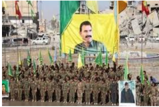
جشن روز آزادی رقه

در جمع‌بندی می‌توان گفت پس از آغاز اعتراض‌های سال ۲۰۱۱ سوریه در شمال و شمال شرق این کشور، سه منطقه «فدرال» اعلام موجودیت کردند به اسم‌های جزیره، فرات و عفرین.