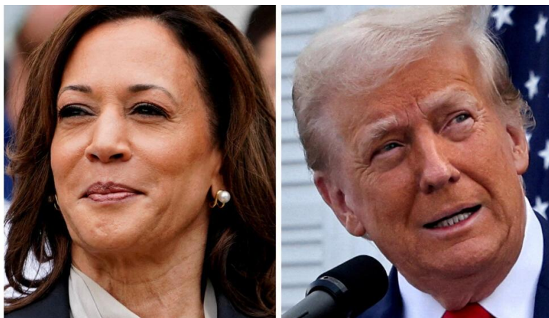
دونالد ترامپ و کاملا هریس دو نامزد انتخابات ریاست جمهوری آمریکا

کاملا هریس و دونالد ترامپ یک روز مانده به روز رای‌گیری انتخابات ریاست جمهوری آمریکا، کارزارهای خود را با مجموعه‌ای از تجمعات و حضورهای رسانه‌ای در ایالت‌های کلیدی به‌ویژه در شمال شرقی ایالات متحده تشدید کردند. در آخرین روزهای منتهی به انتخابات ریاست جمهوری آمریکا که در تاریخ ۵ نوامبر برگزار خواهد شد، کاملا هریس معاون جو بایدن و نامزد دموکرات‌ها و دونالد ترامپ نامزد جمهوری‌خواهان، در حالی که در رقابتی تنگ‌تنگ برای کسب برتری در فرصت‌های باقی‌مانده به سر می‌برند، به ایالت‌های سرنوشت‌ساز در نتیجه انتخابات سفر کردند. کارزار سیاسی میان دو رقیب انتخاباتی به شدت تنش‌آلود است و از هم اکنون باعث افزایش نگرانی از بروز خشونت‌ها در کشور شده است به ویژه اگر آرای دو نامزد انتخاباتی بسیار به یکدیگر نزدیک باشند. در کشوری که شکاف‌های سیاسی در آن در نتیجه کارزارهای انتخاباتی شدیداً عمیق شده‌اند شاید نتیجه قطعی انتخابات روزها پس از پایان آن اعلام شود. تاکنون بیش از هفتاد و سه میلیون آمریکایی آرای خود را پیش از موعد به صندوق‌ها ریخته‌اند. دونالد ترامپ از هم اکنون از وقوع برخی تقلب‌ها و تخلف‌های انتخاباتی سخن گفته است. برای پیش‌گیری از بروز خشونت‌های بی‌سابقه علیه ساختمان کنگره آمریکا شبیه آنچه در ششم ژانویه ۲۰۲۱ روی داد، پایتخت آمریکا تحت تدابیر و مراقبت‌های شدید امنیتی قرار گرفته است.