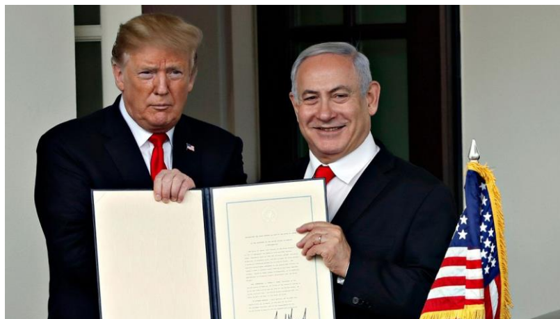
نتان یاهو و ترامپ

طرفداران فلسطین در جناح چپ دموکرات‌ها نیز تمایل دارند که سیاست‌های حزب‌شان به سمت حمایت از فلسطین متمایل شود. چنین تغییری برای کسانی که معتقدند آمریکا باید در روابط امنیتی خود با اسرائیل تجدیدنظر کند، پیروزی بزرگی محسوب می‌شود. بدترین سناریوی ممکن برای اسرائیل این است که موضوع حق موجودیت آن به مسئله‌ای حزبی در آمریکا تبدیل شود. این مسئله اکنون در مورد اوکراین قابل مشاهده است، زیرا بحث حاکمیت ملی و توانایی دفاع از آن در گرو نتیجه انتخابات ریاست جمهوری آمریکا است.