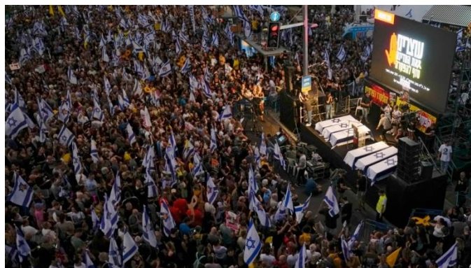
تظاهرات شهروندان اسرائیلی در شهر تل‌آویو

یوآو گالانت، وزیر دفاع اسرائیل، و داوید بارنیا، رئیس موساد، نیز پیش‌تر هشدار داده بودند که شرایط تازه‌ای که نخست‌وزیر اسرائیل وضع کرده است، مانع از دستیابی به توافق خواهد بود.