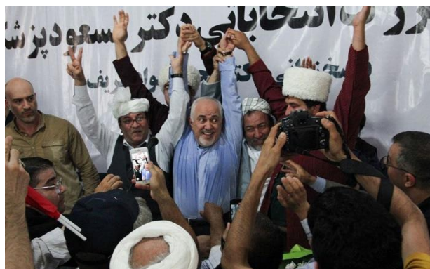
محمدجواد ظریف در تجمع انتخاباتی مسعود پزشکیان در گرگان

روحانی در دولت دوم خود در احکام جداگانه‌ای معصومه ابتکار را به سمت معاون رئیس‌جمهور در امور زنان و خانواده، لعیبا جنیدی را به‌عنوان معاون حقوقی و شهیندخت مولاوردی را به‌عنوان دستیار خود در امور حقوق شهروندی منصوب کرده بود.