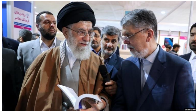
علی خامنه‌ای (چپ) رهبر جمهوری اسلامی و عباس صالحی در نمایشگاه کتاب تهران، ۱۳۹۸

با گروه ۵+۱ بود. او از سال ۱۴۰۰ نیز دبیر شورای راهبردی روابط خارجی بود. شورای راهبردی روابط خارجی از سال ۱۳۸۵ به دستور سیدعلی خامنه‌ای تشکیل شد و «تهیه راهبردها و سیاست‌ها و راهکارهایی که جمهوری اسلامی را در سیاست خارجی به نتایج مطلوب برساند» و «ایجاد هماهنگی بیش‌تر در کلیه فعالیت‌ها در عرصه روابط خارجی» جزو اهداف آن اعلام شده است. برای وزارت کشور اسکندر مومنی و برای وزارت دفاع امیرعزیز نصیرزاده معرفی شدند. سر‌تیپ پاسدار اسکندر مومنی از فرماندهان سپاه پاسداران در دوران جنگ ایران و عراق بود و در حال حاضر دبیر ستاد مبارزه با مخدر است. او هم‌چنین از بنیان‌گذاران و روسای پلیس ۱۱۰ بوده و پیش‌تر نیز جانشین و معاون فرماندهی نیروی انتظامی و رئیس پلیس راهنمایی و رانندگی بوده است. وزارت فرهنگ و ارشاد اسلامی نیز برای سیدعباس صالحی در نظر گرفته شده که در دو دولت حسن روحانی مدتی معاون وزیر و سپس وزیر فرهنگ و ارشاد اسلامی بود.