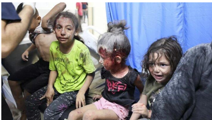
کودکان غرق خون در غزه

اما امسال نه تنها کار کودک، بلکه کشتار کودکان فلسطینی و ایرانی هم به یکی از بزرگ‌ترین فجایع بزرگ انسانی روز تبدیل شده است. بنابراین، نمی‌توان از کار کودک و خیابان حرف زد اما به کشتار کودکان در ایران و غزه نپرداخت! بر اساس یک گزارش جدید سازمان ملل متحد، خشونت علیه کودکان گرفتار در درگیری‌های فزاینده سال ۲۰۲۳ با تعداد بی‌سابقه کودکان کشته شده و زخمی شده، از اسرائیل و سرزمین‌های فلسطینی تا سودان، میانمار و اوکراین به «سطح بالایی» رسید. گزارش سالانه سازمان ملل متحد در مورد وضعیت کودکان در درگیری‌های مسلحانه، از «افزایش تکان‌دهنده ۲۱ درصدی تلفات شدید» علیه کودکان زیر ۱۸ سال در مجموعه‌ای از درگیری‌ها خبر می‌دهد. این درگیری‌ها از جمله در کشورهای کنگو، بورکینافاسو، سومالی و سوریه روی داده است. هم‌چنین برای اولین بار، سازمان ملل متحد، نیروهای اسرائیلی را در لیست سپاه کشورهای قرار داد که حقوق کودکان را به دلیل کشتن و معلول کردن کودکان و حمله به مدارس و بیمارستان‌ها نقض می‌کنند.